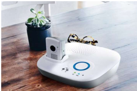
KombiRuf – für zu Hause und unterwegs