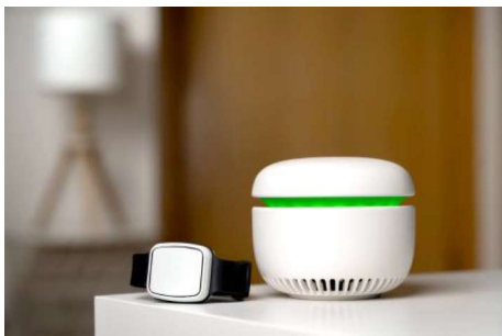
NEU: Caru – für zu Hause