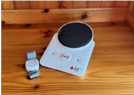
Hausnotrufgerät für zu Hause